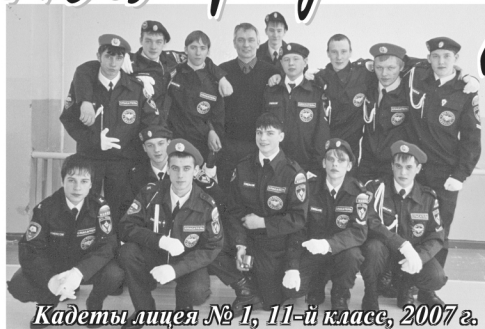
Кадеты лицея №1, 11-й класс, 2007 г.