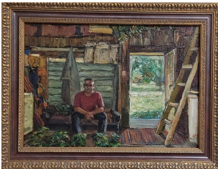
Андрей Степанович на отдыхе – картина Козикова А.А.

Андрей Степанович любил деревню, с уважением относился к людям «простым», трудолюбивым, так как его родители сами выросли в белорусской деревне, где позже он часто проводил время на каникулах.